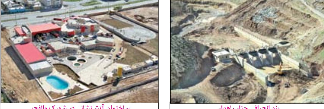
بند انحرافی چنار راهدار