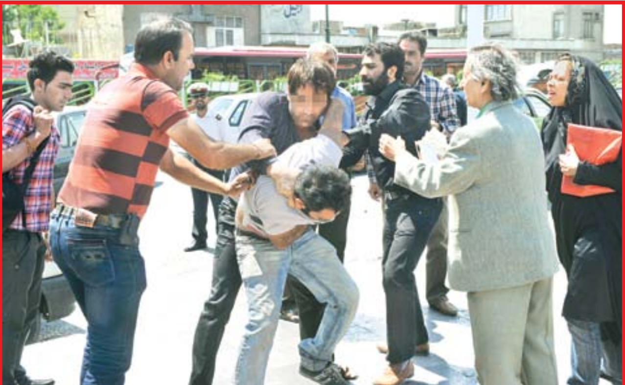
درگیری راننده خودرو شخصی با مسافر بر سر کرایه در حضور خبرنگار کیهان