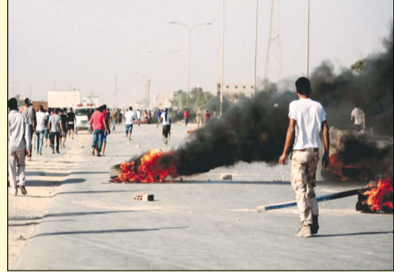
در پی درگیری‌های بنغازی که ۳۱ کشته و ۱۰۰۰ مجروح به دنبال داشت، دولت لیبی سه روز عزای عمومی اعلام و با استعفاى رئیس ستاد مشترک موافقت کرد.

به گزارش خبرگزاری‌ها، در پی درگیری متقابل میان تظاهرکنندگان و شبه‌نظامیان مستقر در یک پادگان شهر بنغازی که شنبه گذشته اتفاق افتاد، دولت لیبی سه روز عزای عمومی اعلام کرد. این درگیری ۳۱ کشته و ۱۰۰۰ مجروح به دنبال داشته است. تظاهرکنندگان خواستار خلع سلاح شبه‌نظامیان و تحویل سلاح‌ها به ارتش بودند. شبه‌نظامیان مستقر در پادگان که موسوم به «گردان سپر لیبی» هستند، انقلابیونی هستند که با رژیم «معمر قذافی» چنگ‌بند لیبی و اکنون نیز بخشی از نیروهای مسلح ارتش لیبی را تشکیل می‌دهند.