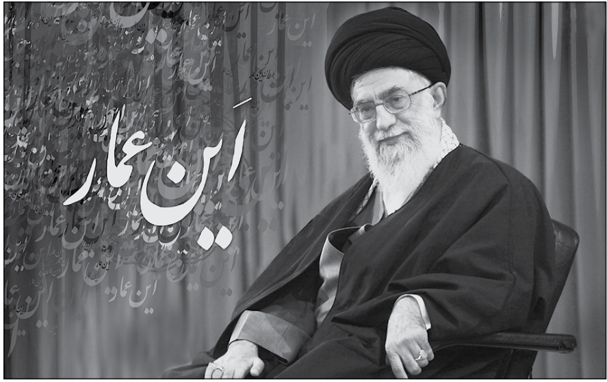
آیت الله العظمی‌ ابن‌عمران

رهبر انقلاب از مدتها قبل از انتخابات به خصوص در سخنرانی اول فروردین ۱۳۸۸در مشهد مقدس، در اولین تذکرات در باب انتخابات پیش رو، با تیز بینی کسانی که تا آن لحظه هنوز به صورت رسمی کاندیدای انتخابات نشده بودند را از طرح شبهه تقلب در انتخابات بر حذر داشتند ونسبت به زیر سؤال بردن سلامت انتخابات هشدار دادند.