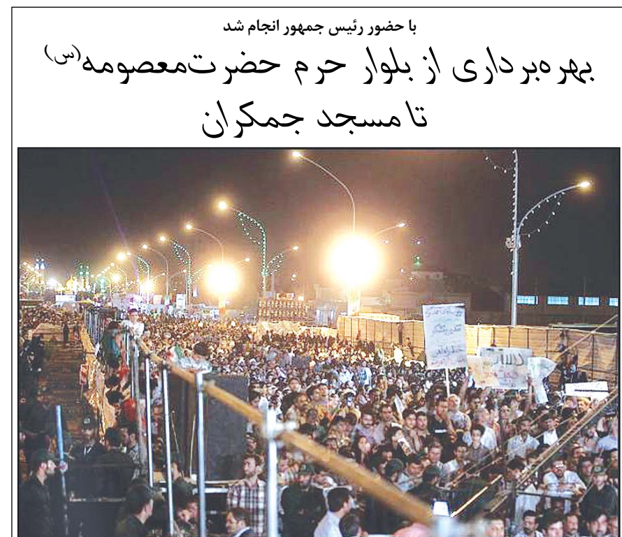
با حضور رئیس جمهور انجام شد بهره برداری از بلوار حرم حضرت معصومه (س) تا مسجد جمکران

تیم ۱۶ نفره دانش آموزان راهنمایی و دبیرستان ایران در مسابقات جهانی ریاضی در آمریکا، روسیه، آلمان، فرانسه، بلژیک و بلاروس با نمره ۴۲۰۰ نفره جهان از جمله آمریکا، روسیه، آلمان، فرانسه، بلژیک و بلاروس را شکست داد.