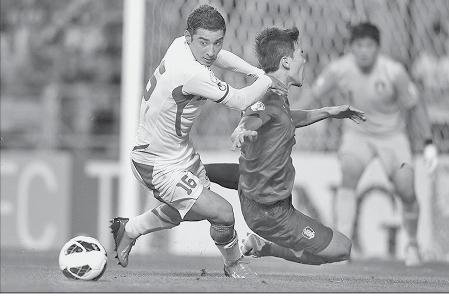
غنا و نیجریه

گلدان ۳ : استرالیا، کانستاریکا، هندوراس، ایران، ژاپن، کرو، کوبا، مکزیک و آمریکا