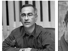
پروانه معصومی (بازیگر)