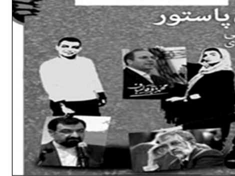
مستند: «انتهای خیابان پاستور»

ننوانسته است تصویری صحیح از شرایط انتخابات به نمایش درآورد.